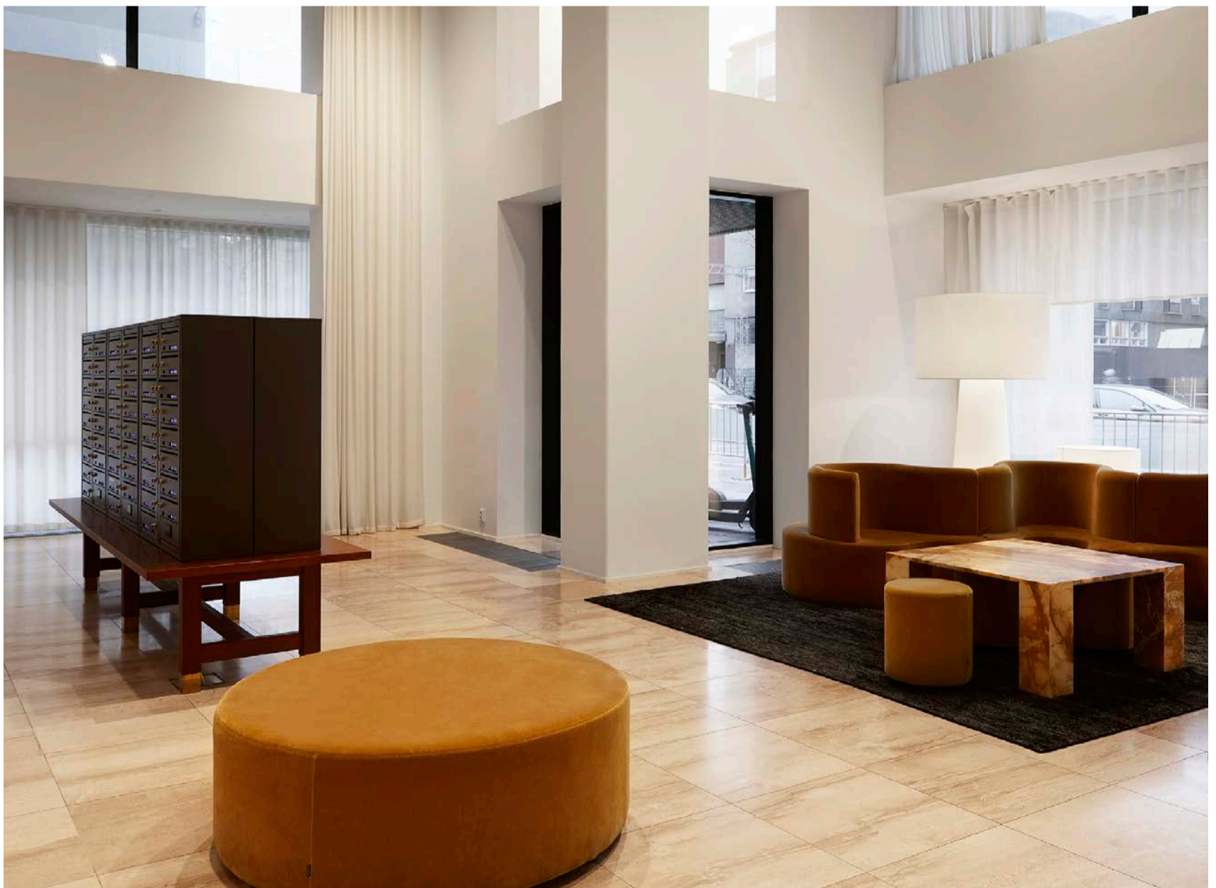
I entrén kan besökare sätta sig på Verner Pantons berömda soffa Cloverleaf som designades 1969.

Vi ville hålla inredningen enkel och inte möblera bort utsikten.