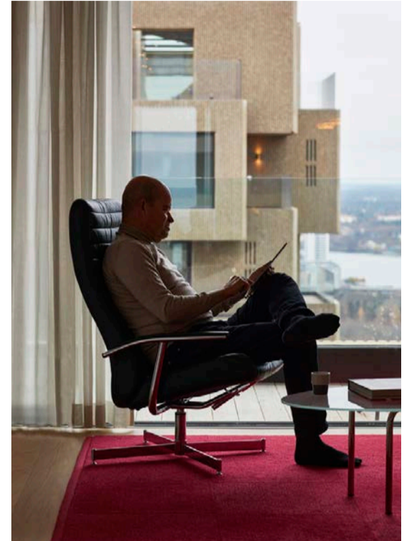
Från vardagsrummet har man utsikt över tvillingtornet Helix. Fåtölj från Bo Concept, soffbordet är specialtillverkat.