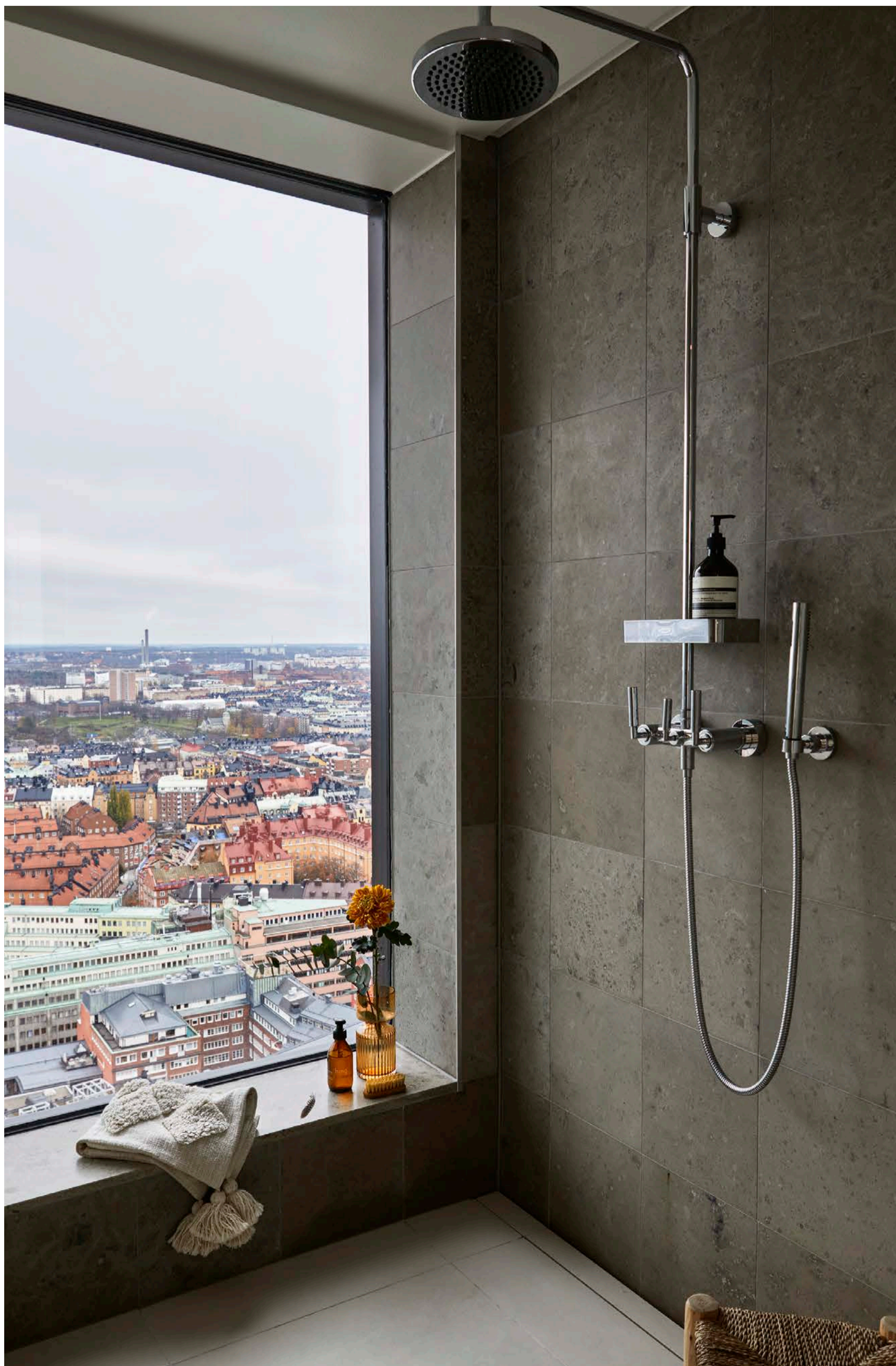
Badrummet är klätt i ljus natursten och har försetts med ett stort panorama-fönster. Duschblandare från Dornbracht.